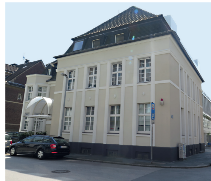
3. PLATZ «Häuser ohne Stuck»: Am Mühlenberg 14, DU-Mitte