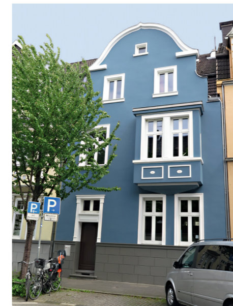
1. PLATZ «Häuser ohne Stuck»: Neckarstraße 54, DU-Mitte