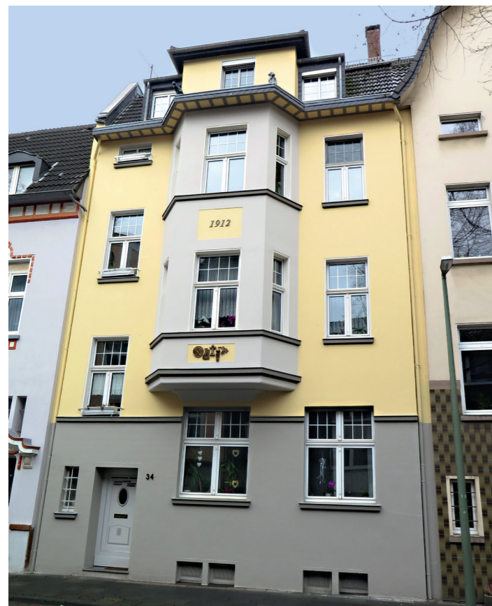
1. PLATZ «Häuser mit Stuck»: Kanzlerstraße 34, DU-Laar