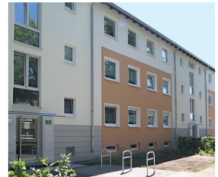
1. PLATZ «Sondergruppe Wohnsiedlungen»: Kaufstraße 53 – 57, DU-Wanheimerort