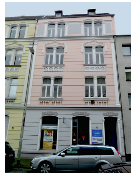
3. PLATZ «Häuser mit Stuck»: Moltkestraße 35, DU-Mitte