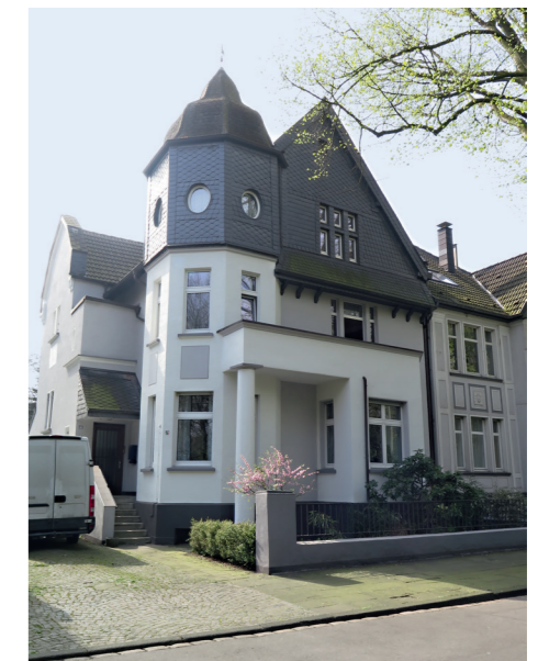
2. PLATZ «Häuser ohne Stuck»: Bayernstraße 68, DU-Marxloh