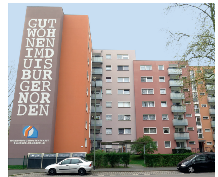
3. PLATZ «Sondergruppe Wohnsiedlungen»: Lehrerstraße 66 – 78, DU-Hamborn