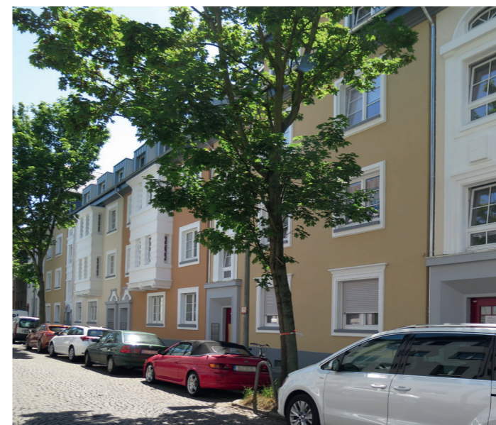
2. PLATZ «Sondergruppe Wohnsiedlungen»: Krautstraße 4 – 14, DU-Neudorf