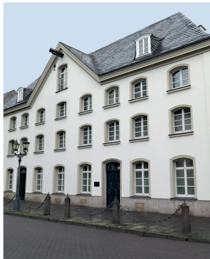
2. PLATZ «Häuser mit Stuck»: Franz-Haniel-Platz 1, DU-Ruhrort