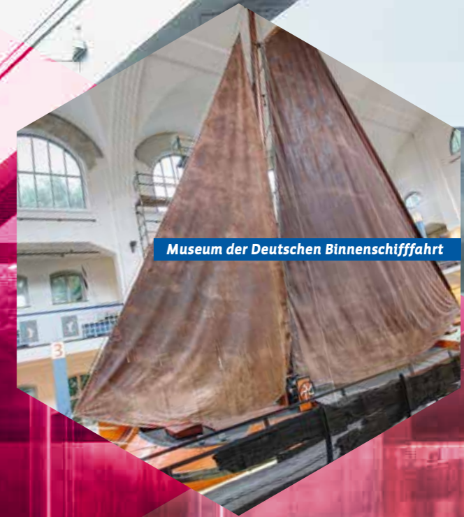
Museum der Deutschen Binnenschifffahrt

Erste Adresse internationaler Skulptur- und Objektkunst ist das Lehmbruck Museum, das ebenso wie die Cubus Kunsthalle im Duisburger Kant-Park angesiedelt ist. Ebenso hochkarätig ist die Sammlung im MKM Museum Küppersmühle für Moderne Kunst. Mit alter und neuer Kunst begeistert das Museum DKM. Die über tausendjährige Geschichte Duisburgs wird im Kultur- und Stadthistorischen Museum dokumentiert. Untrennbar mit Duisburgs Geschichte verbunden ist auch das Museum der Deutschen Binnenschifffahrt.