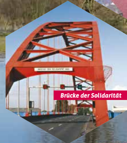
Brücke der Solidarität

Der Bezirk ist wie große Teile des Duisburger Nordens industriell ge- prägt. Das Areal der aktiven Stahlpro- duktion ist riesig. Hier befindet sich auch das ehemalige Meidericher Hüt- tenwerk, das jetzige Freizeitparadies Landschaftspark Duisburg-Nord, laut „The Guardian“ einer der 10 schönsten Landschaftsparks weltweit. Außerhalb unserer Stadt kennt jeder auch den MSV Duisburg, den Meidericher Spielverein, und das in Beeck gebraute Bier, das König Pilsener.