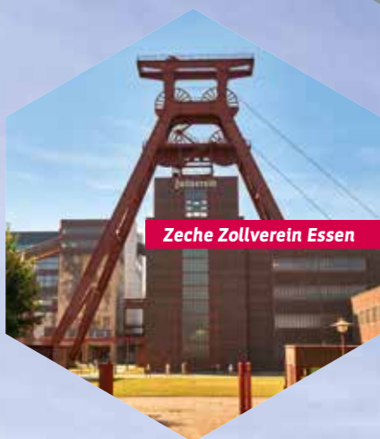
Zeche Zollverein Essen