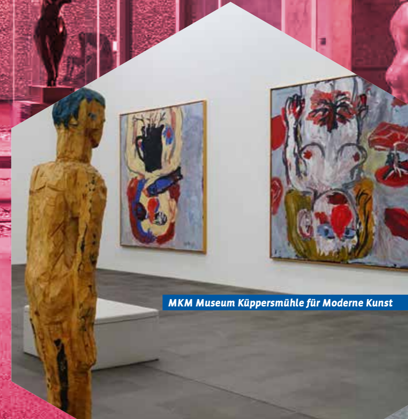
MKM Museum Küppersmühle für Moderne Kunst