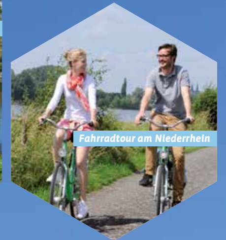
Fahrradtour am Niederrhein