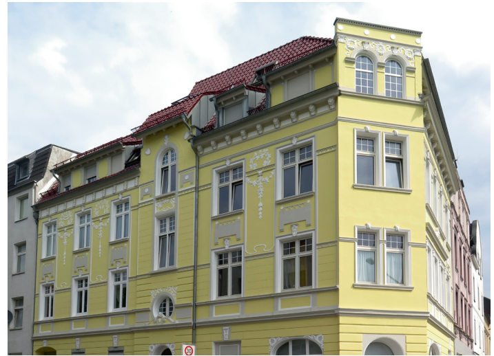
1. PLATZ «Häuser mit Stuck»: Krautstr. 33, DU-Neudorf