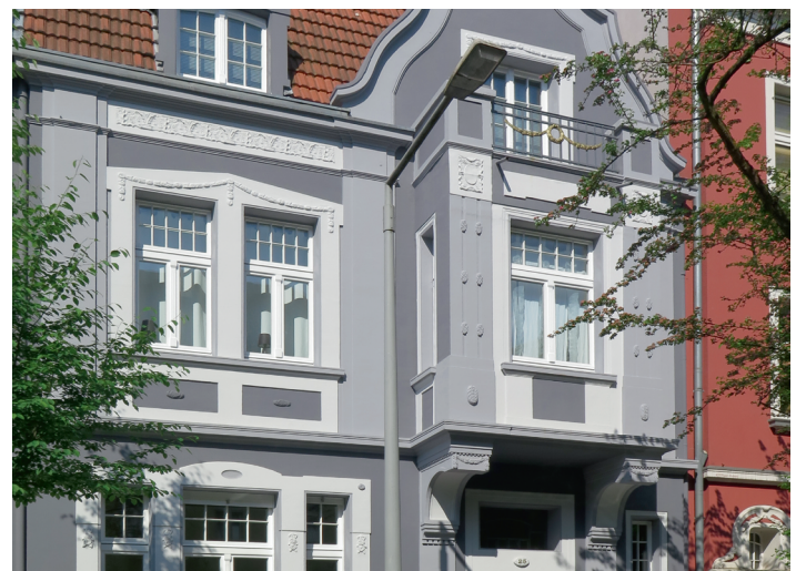
2. PLATZ «Häuser mit Stuck»: Siegstr. 25, DU-Altstadt