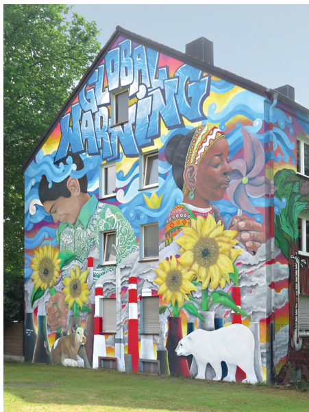
2. PLATZ «Hinterfronten / Hinterhöfe»: Düsseldorferstr. 139, DU-Dellviertel