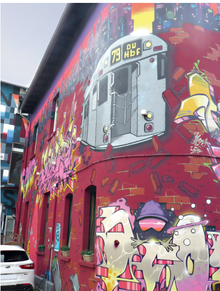
1. PLATZ «Hinterfronten / Hinterhöfe»: Musfeldstr. 84, DU-Dellviertel