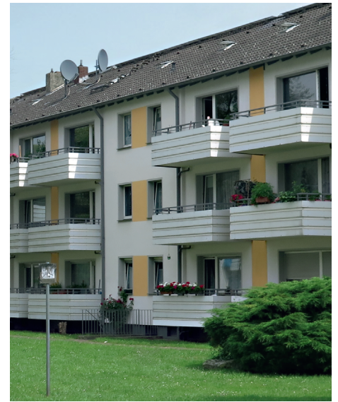
3. PLATZ «Wohnsiedlungen»: Rheinstr. 22-26 / Friedrich-Eber-Str. 41-47 / Apostelstr. 66-72, DU-Laar