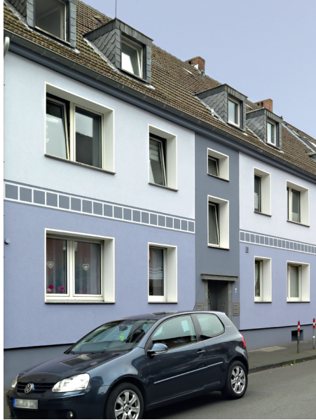
2. PLATZ «Häuser ohne Stuck»: Hoher Weg 7+9, DU-Mittelmeiderich