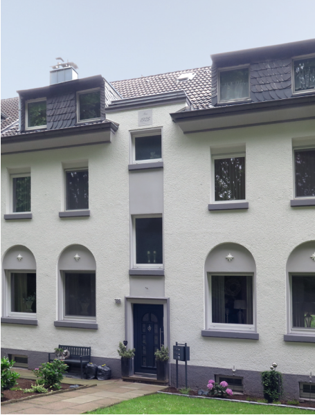
1. PLATZ «Häuser ohne Stuck»: Wilhelmstr. 126, DU-Homberg