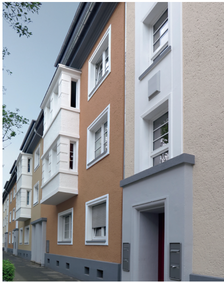
2. PLATZ «Wohnsiedlungen»: Grabenstr. 205-209 / Akazienstr. 1-11, DU-Neudorf