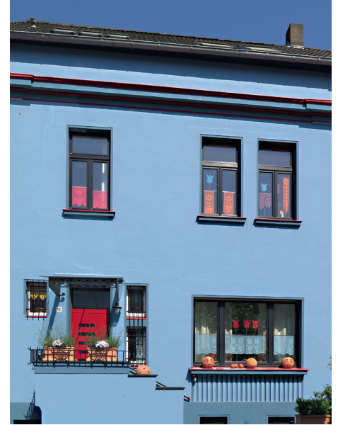
3. PLATZ «Häuser ohne Stuck»: Hohenstaufenstr. 19, DU-Duissern