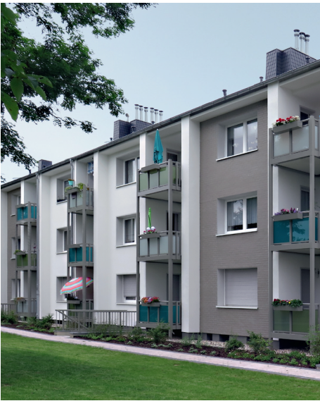
1. PLATZ «Wohnsiedlungen»: Eifelstr. 1-11 / Uettelsheimer Weg 39-49, DU-Homberg