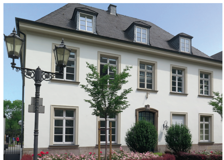
3. PLATZ «Häuser mit Stuck»: Franz Haniel Platz 1, DU-Ruhrort